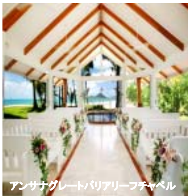
アンサナグレートバリアリーフチャペル