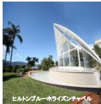
ヒルトンブルーホライズンチャペル